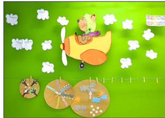
Beispielfoto: Raumgestaltung eines Gruppenraumes in unserer Kinderkrippe in Reutlingen sowie Wanddecoration in unserer Kinderkrippe in München, Frankenthaler Straße

Die räumliche Ausstattung und Ausgestaltung orientiert sich an den Bedürfnissen der uns anvertrauten Säuglinge, Kleinkinder und Kinder. Gemeinsames Spielen ist ebenso möglich wie vorübergehender Rückzug. Das Bedürfnis nach aktiver körperlicher Bewegung kann ebenso erfüllt werden, wie der Wunsch des Kindes nach Kontaktaufnahme zum pädagogischen Fachpersonal und einem Spiel und Dialog mit ihr/ihm. Wir bieten entwicklungsgerechte Einrichtungsgegenstände und Spielmaterialien an und geben genügend Freiraum zum Krabbeln, Laufen, Hüpfen, zum Ziehen oder Schieben größerer Wagen und Ähnlichem. So sind die Laufwege frei und ohne Hindernisse. Klare Raumstrukturen unterstützen die Orientierung des Kindes im Raum. Wir haben unsere Gruppenräume so gegliedert, dass bestimmte Spiele in den dafür vorgesehenen Bereichen ermöglicht werden und die Spielutensilien dort erreichbar sind.