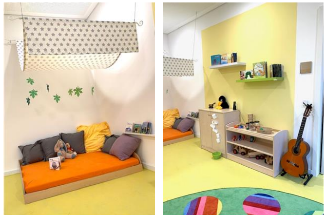
Beispielfoto: Gruppenraum der Kinderkrippe und Kindergarten unserer Einrichtung Schwabing Freimann

Alle unsere Gruppenräume sind dabei in thematische Bereiche eingeteilt (z.B. Rollenspiel, Bauecke und Lesecke, Tische für Regelspiele oder der Mal- und Kreativtisch). Die Kinder können sich an diesen Bereichen orientieren und finden das gewünschte Spiel- und Kreativmaterial immer wieder vor. Die Verlässlichkeit des Raumes, und dass jedes Spielmaterial immer an seinem Platz zu finden ist, gibt den Kindern dabei zusätzlich Sicherheit sich frei im Gruppenraum entfalten zu können. Zudem ermöglichen die verschiedenen Bereiche das Spielen in Kleingruppen sowie das Auswählen nach dem persönlichen Interesse des Kindes.