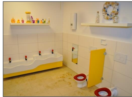
Beispielfoto: Unser Schlafrum im Denk mit! Kinderhaus in Trossingen und das Krippenbad im Denk mit! Kinderhaus in Tutzing.

Der großzügige Eingangsbereich bietet Gelegenheit, Eltern, Kinder und Geschwisterkinder in der Einrichtung willkommen zu heißen. Die Garderoben befinden sich sowohl im Eingangs- als auch in den weitläufigen Flurbereichen.