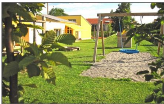
Beispielfoto: Garten in Olching Esting

Der Garten bietet spannende Bewegungsanregungen. Die Kinder können ihr Klettertalent am Spielturm mit Kletternetz und Rutsche erproben, unterschiedliche Pflanzen beim Wachsen beobachten. Ein Bobycarbereich lädt dazu ein, erste Erfahrungen mit Geschwindigkeit und Koordination zu erproben. Im Sandkasten dürfen die Kinder ihre Kreativität ausleben und beim Balancieren auf liegenden Kletterstämmen ihren Körper bewusst wahrnehmen. Sie erleben, wie es sich anfühlt auf unterschiedlichen Untergründen wie Sand, Matsch, Teer oder Gras zu laufen. Zusätzlich können sie sich mit Spielmaterialien, Schwungtuch, Hüpftiere oder verschiedene Bälle und Tücher beschäftigen, welche die Fachkräfte nach Bedarf zur Verfügung stellen..