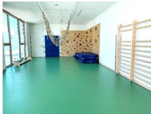
Beispielfoto: Flur mit Garderobe im Haus für Kinder in München-Waldperlach und unser Bewegungsraum in Ramersdorf Perlach

In der Einrichtung befindet sich ein Mehrzweckraum mit einer Fläche von ca. 30 m 2 . Dieser wird von den Kindergartenkindern während der Schlafzeit der Krippenkinder oder im Einrichtungsalltag als Turnhalle genutzt. Die Multifunktionalität wird bei der Raumausstattung erkennbar, so können nahezu alle Turngeräte auf- und abgebaut werden. Dies ermöglicht den Kindern Freiraum zum Toben und