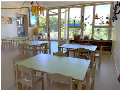
Beispielfoto: Kindergartengruppe in Ramersdorf Perlach

Unser Gruppenraum im Kindergarten ist mit anregenden Spiel- und Kreativmaterialien für Beschäftigungen wie Basteln, Bauen, Rollenspiele oder Tischspiele ausgestattet. Es laden eine Puppenecke, eine Kuschecke bestehend aus einem Sofa mit vielen Kissen und Decken, sowie verschiedene Möglichkeiten von Brettspielen, Puzzeln, Büchern und vielem mehr, die Kinder zum Spielen ein.