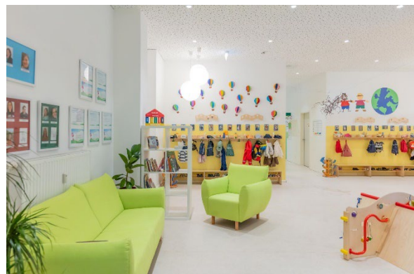
Bild 4 & 5: Raumgestaltung unserer Denk mit Kita München Schwanthalerhöhe

Die räumliche Ausstattung und Ausgestaltung orientierten sich an den Bedürfnissen der uns anvertrauten Säuglinge, Kleinkinder und Kinder. Gemeinsames Spielen ist ebenso möglich wie vorübergehender Rückzug. Das Bedürfnis nach aktiver körperlicher Bewegung kann ebenso erfüllt werden, wie der Wunsch des Kindes nach Kontaktaufnahme zum pädagogischen Fachpersonal und einem gemeinsamen Spiel und Dialog. Damit sich die Kinder gut orientieren, in der Eingewöhnungszeit Vertrauen aufbauen und Vertrautes wiedererkennen können, ist die gute Strukturierung der Gruppenräume Grundlage.