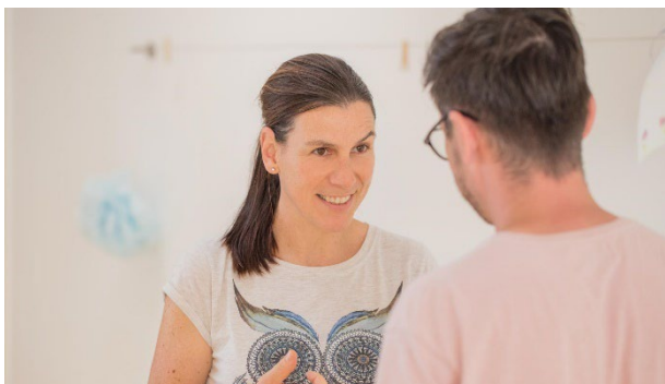
Bild: Offener Austausch

Der Kontakt und die Zusammenarbeit mit den Familien ist ein wichtiger Teil des täglichen Miteinanders. Unsere Fachkräfte fördern kontinuierlich einen guten und offenen Austausch mit den Familien, um den Bedürfnissen der Familien und der Kinder gerecht zu werden. Uns ist es sehr wichtig, dass sich sowohl die Kinder als auch die Familien in unserer Kita wohl fühlen.