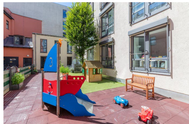
Bild 9 & 10: Mehrzweckraum und Garten der Denk mit Kita München Schwanthalerhöhe