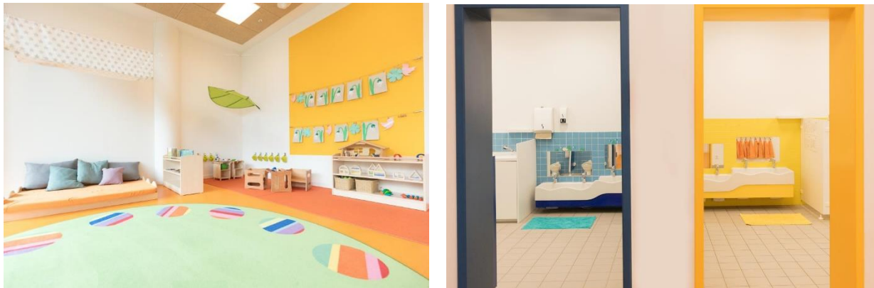
Bild 7 & 8: Gruppenraum und Kinderbad in der Denk mit Kita München Bogenhausen, Bavaria Towers

Der Krippenteppich „Circelino“ dient im Gruppenraum als täglicher Treffpunkt für den Morgenkreis. Auf seinen zwölf Punkten findet jedes Kind einen Platz und gemeinsam kann im Morgenkreis der Tag mit Fingerspielen, Liedern und dem gemeinsamen Zählen der Kinder begonnen werden.