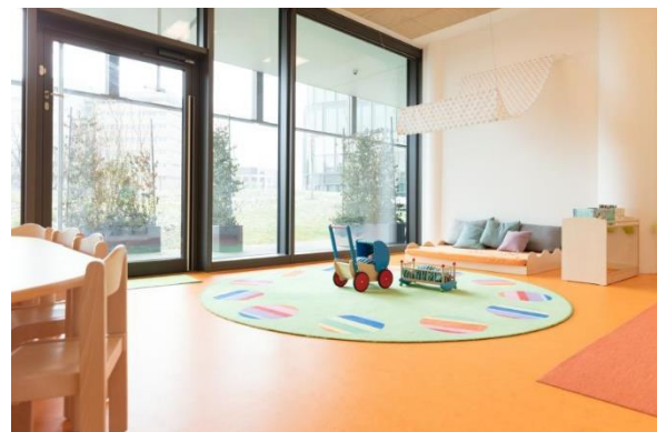
Bild 4 & 5: Raumgestaltung unserer Denk mit Kita München Bogenhausen, Bavaria Towers

Die räumliche Ausstattung und Ausgestaltung orientierten sich an den Bedürfnissen der uns anvertrauten Säuglinge, Kleinkinder und Kinder. Gemeinsames Spielen ist ebenso möglich wie vorübergehender Rückzug. Das Bedürfnis nach aktiver körperlicher Bewegung kann ebenso erfüllt werden, wie der Wunsch des Kindes nach Kontaktaufnahme zum pädagogischen Fachpersonal und einem gemeinsamen Spiel und Dialog. Damit sich die Kinder gut orientieren, in der Eingewöhnungszeit Vertrauen aufbauen und Vertrautes wiedererkennen können, ist die gute Strukturierung der Gruppenräume Grundlage.