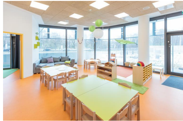
Bild 9 & 10: Mehrzweckraum und Gruppenraum der Denk mit Kita München Bogenhausen, Bavaria Towers

Der Garderoben- und Eingangsbereiche bietet Gelegenheit, Eltern, Kinder und Geschwisterkinder in der Einrichtung willkommen zu heißen. Durch den Windfang betritt man die Einrichtung und hat direkt die Möglichkeit die Schuhe der Kinder und der Eltern (durch mobile Hausschuwägen mit Sitzbänken) zu tauschen. Der großzügige Mehrzweckraum wird multifunktional auch als Garderobe genutzt. Dieser wird sowohl für die Krippenkinder als auch für die Kindergartenkinder ausgestattet. Zur Bewegungsförderung dienen eine Sprossenwand (die durch ein Mattengurtsystem extra nur zeitweise genutzt werden kann) und pädagogisches Material wie Bälle, Seile, Reifen und Tücher, die in mobilen Turnraumwägen verstaut werden.