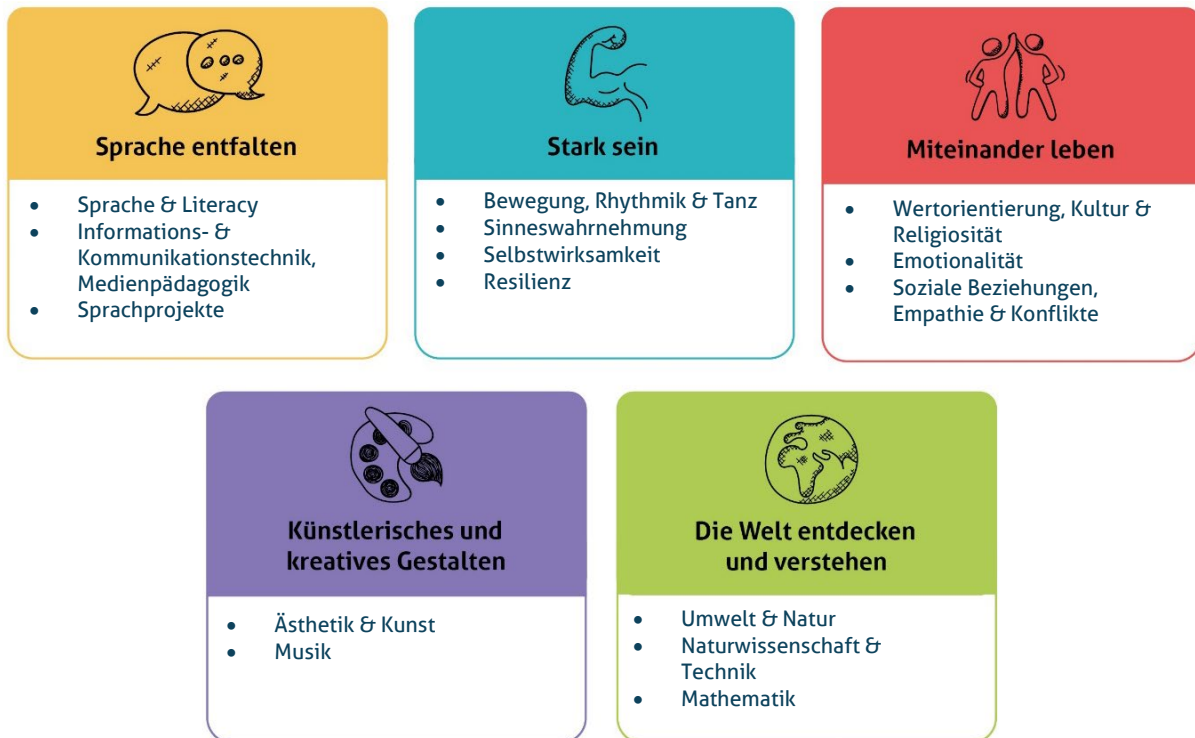
Abbildung 1: Die fünf Erfahrungsbereiche von Denk mit Kita für eine ganzheitliche Bildung

Wir sehen die Basiskompetenzen als Grundlage für weiteres Lernen. Sie dienen der Persönlichkeitsentwicklung und sind der Grundstein für die Interaktion und Auseinandersetzung mit anderen Individuen und unserer Umwelt. Die Basiskompetenzen werden im Kleinkindalter vorwiegend über Bewegung im freien Spiel und im Alltag entwickelt sowie durch eigene Erfahrungen und Erlebnisse gefestigt. Die Umsetzung der genannten Bildungs- und Erziehungsziele erfolgt durch unsere fünf Erfahrungsbereiche. So ist es uns möglich in unserer pädagogischen Arbeit alle Erfahrungsbereiche in der Woche aufzugreifen und ganzheitliche Bildung zu garantieren. Zudem können wir diese für die Familien in unseren Wochenplänen sichtbar dokumentieren. Die Bereiche dienen den Mitarbeitern zur Orientierung und als Leitfaden für die Planung und Umsetzung vielfältiger Projekte. Nach dem Prinzip der ganzheitlichen Bildung stellen unsere fünf Erfahrungsbereiche ein vielfältiges Angebot dar, in dem unsere Kinder mit allen Sinnen und vollem Körpereinsatz die Welt erforschen dürfen.