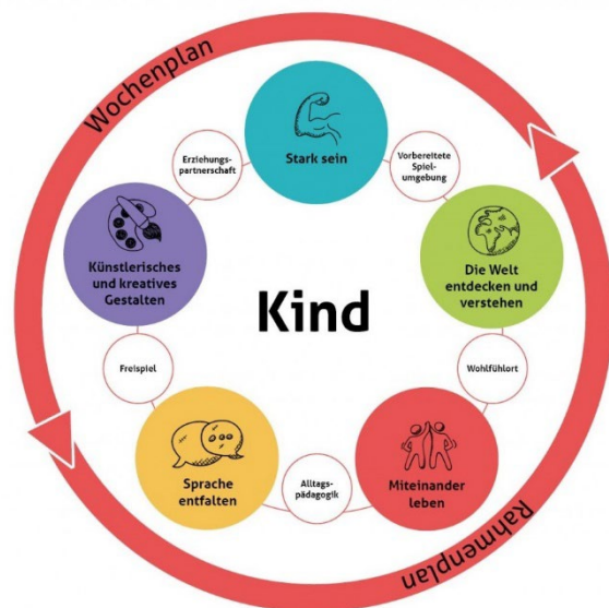
Abbildung 2: Pädagogik von Denk mit Kita

Besonders bei Übergängen wie beispielsweise in der morgendlichen „Bringsituation“ suchen manche Kinder die körperliche Nähe zu einer Bezugsperson und sollen dabei auch die gewünschte individuelle Aufmerksamkeit erhalten.