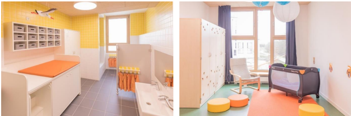
Bild 7 & 8: Beispielbilder Kinderbad und Schlafräum in der Denk mit Kita München Neuperlach Süd

Unsere Krippengruppen besitzen neben ihrem großzügigen Gruppenraum einen direkten Zugang zu einem Nebenraum, welcher als Ruheraum genutzt wird. Jedes Kind bekommt dort seinen eigenen Ruheplatz mit einer Liege und eigenem Bettzeug bzw. einem Schlafsack und dem mitgebrachten Stofftier. Während der Ruhephase können die Krippenkinder nach einem erlebnisreichen Vormittag neue Energie für den Nachmittag sammeln. Dieser Schlafplatz wird entsprechend gekennzeichnet. Jedes Kind findet selbst sein Bett und erfährt Sicherheit, da sich dieses gemeinsam mit dem eigenen Kuscheltier oder Schnuller immer am selben Platz befindet.