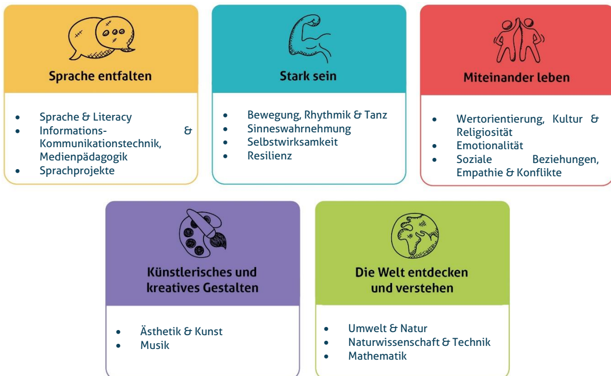
Abbildung 1: Die fünf Erfahrungsbereiche von Denk mit Kita für eine ganzheitliche Bildung