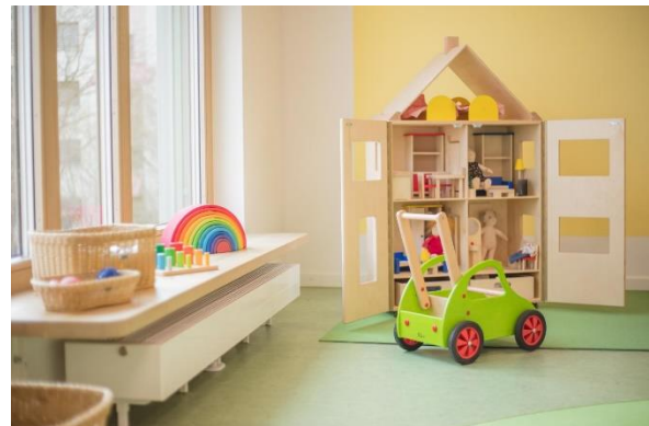
Bild 4 & 5: Beispielbilder Raumgestaltung unserer Denk mit Kita München Neuperlach-Süd

Die räumliche Ausstattung und Ausgestaltung orientieren sich an den Bedürfnissen der uns anvertrauten Säuglinge, Kleinkinder und Kinder. Gemeinsames Spielen ist ebenso möglich wie vorübergehender Rückzug. Das Bedürfnis nach aktiver körperlicher Bewegung kann ebenso erfüllt werden, wie der Wunsch des Kindes nach Kontaktaufnahme zum pädagogischen Fachpersonal und einem gemeinsamen Spiel und Dialog. Damit sich die Kinder gut orientieren, in der Eingewöhnungszeit Vertrauen aufbauen und Vertrautes wiedererkennen können, ist die gute Strukturierung der Gruppenräume Grundlage.