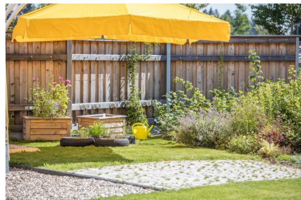
Bild 9 & 10: Beispielbilder Garten der Denk mit Kita München Neuperlach Süd.

Dort steht den Kindern eine Rutsche sowie ein Holzspielgerät Verfügung. Ein Sandspielbereich ergänzt die Nutzungsmöglichkeiten des Gartens. Im 2. Obergeschoss befindet sich unsere weitläufige Dachterasse, welche über eine Fahrzeugrennstrecke verfügt. An heißen Tagen lädt der Außenbereich zum Plantschen und Experimentieren ein. Die kleine Terasse, die wir als Kräutergarten gestalten, rundet den Außenbereich ab.