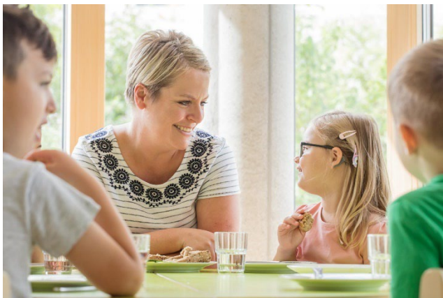
Bild: Pädagogin mit Kind

Nun kann die Zeit, in der das Kind allein in der Gruppe ist, langsam gesteigert werden. Ziel ist es, dass sich das Kind mit seinem eigenen Tempo auf die neue Umgebung, das pädagogische Fachpersonal und die anderen Kinder einstellen kann.