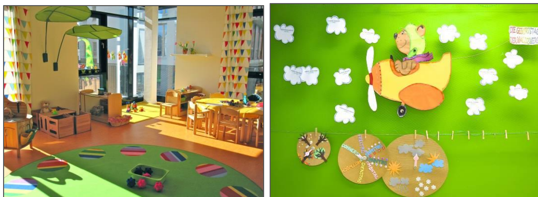
Beispielfoto: Raumgestaltung eines Gruppenraumes in unserer Kinderkrippe in Reutlingen sowie Wanddekoration in unserer Kinderkrippe in München, Frankenthaler Straße

Unser warmherzige Raumatmosphäre und die kindgerechte Gestaltung der Räume tragen wesentlich dazu bei, dass sich die Kinder wohlfühlen. Sich wohl zu fühlen, ist Grundlage optimaler Entwicklung.