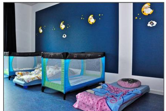
Beispielfoto: Schlafrum in unserem Haus für Kinder in Tutzing

Im Erdgeschoss befindet sich der Gruppen- und Schlafrum der grünen Gruppe. Dieser ist zu einem kleinen stark begrünten Innenhof ausgerichtet. Unterschiedliche Tierbeobachtungen finden somit im Alltag statt. Die tiefen Fenster ermöglichen selbst den jüngsten Kindern den Blick nach draußen. Durch eine Verbindungstür ist der Gruppenraum mit dem Schlafrum verbunden. Ruhe und Erholung finden die Kinder in Ihren eigenen Holzbetten. Uns ist wichtig, dass jedes Kind einen festen Schlafplatz hat, welcher durch ein Foto des Kindes gekennzeichnet ist. So kann jedes Kind sein Bett selbst finden und erfährt Sicherheit, da sich dieses gemeinsam mit dem eigenen Kuscheltier oder Schnuller immer am selben Platz befindet.