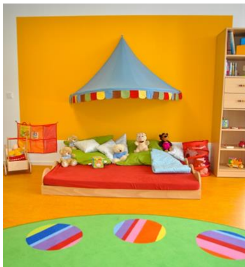
Beispielfoto: Gruppenraum in unserem Haus für Kinder in Tutzing

Der rote Gruppenraum ist flächenmäßig der größte im Haus. Viel Licht kommt durch die große Fensterfront. Die Aussicht bietet einen Blick in einen parkähnlich angelegten Innenhof. Ruhe und Erholung finden die Kinder nach einem erlebnisreichen Vormittag im Schlafrum, der sich auf der anderen Seite des Eingangsbereiches befindet. Hier können unsere Kinder neue Energie für den Nachmittag sammeln. Dieser Schlafrum ist zur Gartenseite der Einrichtung ausgerichtet.