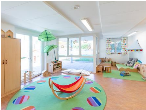
Bilder: Raumgestaltung unserer Denk mit Kita Pfullingen

Unsere warmherzige Raumatmosphäre und die kindgerechte Gestaltung der Räume tragen wesentlich dazu bei, dass sich die Kinder wohlfühlen. Sich wohlfühlen, ist Grundlage optimaler Entwicklung.