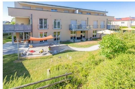
Bilder: Außenfläche unserer Denk mit Kita Pfullingen

Ziel ist es, auch hier ein individuelles und intimes Umfeld für die Kinder zu schaffen, in dem sie sich frei bewegen können und der Alltag zum vorrangigen Lernfeld wird.