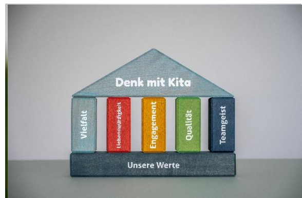
Bild: Unternehmenswerte von Denk mit Kita

Deswegen haben wir uns als Denk mit Kita nicht nur die Werte Engagement und Liebenswürdigkeit vorgenommen, die im Einflussbereich der einzelnen Person liegen, sondern auch den Wert Teamgeist, weil wir der Überzeugung sind, dass die Qualität unserer Arbeit nur im Team erhalten und ausgebaut werden kann. Ein gut funktionierendes, eingespieltes Team wiederum besteht aus engagierten und liebenswürdigen Teammitgliedern, die sich mit diesen Eigenschaften und ihren persönlichen Kompetenzen und Ressourcen eigenverantwortlich in das Team einbringen.