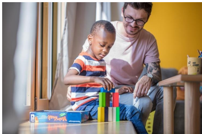
Bild: Pädagoge mit Kind in einer Denk mit Kita

Kinder zeigen schon sehr früh, welche Verhaltensweisen, Situationen, Personen oder Gegenstände sie besonders gernhaben. Diese individuellen Vorlieben zu beobachten und zu stärken, ist Aufgabe unseres pädagogischen Fachpersonals. Wir setzen Vertrauen in die kindliche Neugier und stärken die fragende Haltung der Kinder. Wir unterstützen die Kinder mit wertschätzender Bestätigung, mit emotionalem Rückhalt, mit praktischer Hilfestellung oder mit gezielten Hinweisen. Zudem können die pädagogischen Fachkräfte den Kindern wertvolle Impulse im Freispiel geben, um das Spiel der Kinder zu lenken und stärkend weiterzuentwickeln. Unsere Pädagogen sind Vorbilder bei Konflikt- und Grenzsetzungssituationen im sozialen Geschehen, an denen sich die Kinder im Spiel orientieren können. Jedes Kind signalisiert auf seine Weise, wie viel und welche Art der Unterstützung es benötigt. Jede Entwicklungsphase stellt einen wichtigen Zwischenschritt auf dem Weg zur selbstständigen Bewältigung neuer Anforderungen dar. Die Pädagogen beobachten aufmerksam die kindlichen Verhaltensäußerungen in Mimik und Gestik. Erst wenn es diesen gelingt, die Gefühlszustände, Handlungen und Reaktionen des Kindes differenziert wahrzunehmen, auch feinere Unterschiede im Verhalten zu entdecken oder beginnende Veränderungen zu spüren, kann das pädagogische Fachpersonal die dahinterliegenden Absichten oder Gemütsbewegungen verstehen und