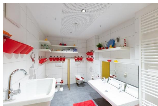
Bilder: Schlafraum und Krippenbad unserer Denk mit Kita Pfullingen

Zusätzlich sind in diesem Bereich Infotafeln angebracht, an welchen die Eltern aktuelle Informationen (z.B. Wochenplan und Speiseplan) unserer Einrichtung einsehen können.