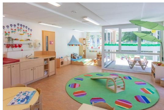
Bilder: Gruppenräume unserer Denk mit Kita Pfullingen

In unseren Schlafräumen finden die Kinder nach einem erlebnisreichen Vormittag Ruhe und können neue Energie für den Nachmittag sammeln. Uns ist wichtig, dass jedes Kind einen festen Schlafplatz hat, welcher durch ein Foto des Kindes gekennzeichnet ist. So kann jedes Kind sein Bett selbst finden und erfährt Sicherheit, da sich dieses gemeinsam mit dem eigenen Kuscheltier oder Schnuller immer am selben Platz befindet.