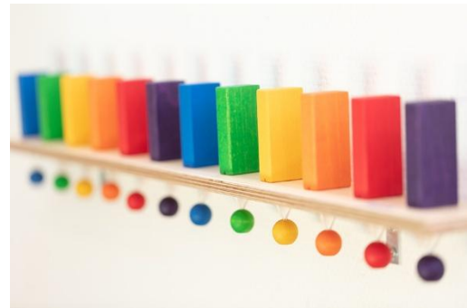
Bilder: Garderobe und Flur unserer Denk mit Kita Pfullingen

Zur Denk mit Kita Pfullingen gehört eine große Außenspielfläche, die ausschließlich den Krippenkindern zur Verfügung steht. Die Freifläche wird durch einen Zaun und Bepflanzung eingegrenzt. Unser Garten ist mit einem Sandkasten, Sonnensegel, kleinkindgerechten Spielgeräten und genügend Platz für Bewegung und Spiel ausgestattet. In unserem Garten können sich die Kinder frei entfalten.