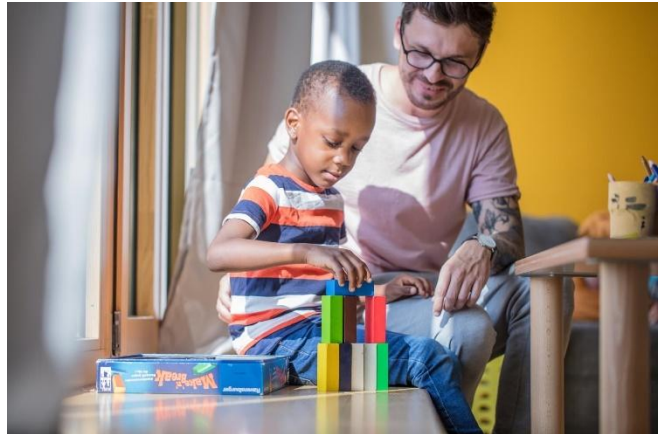
Bild: Pädagoge mit Kind in einer Denk mit Kita

Wir unterstützen die Kinder mit wertschätzender Bestätigung, mit emotionalem Rückhalt, mit praktischer Hilfestellung oder mit gezielten Hinweisen. Zudem können die pädagogischen Fachkräfte den Kindern wertvolle Impulse im Freispiel geben, um das Spiel der Kinder zu lenken und stärkend weiterzuentwickeln. Unsere Pädagogen sind Vorbilder bei Konflikt- und Grenzsetzungssituationen im sozialen