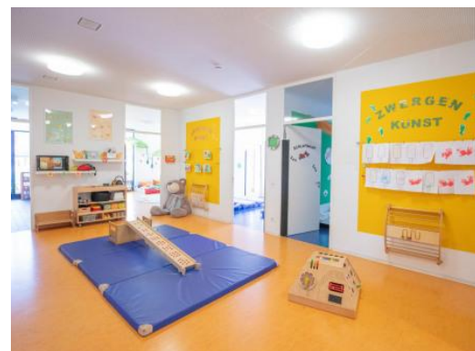
Bild 3 & 4: Beispiele Raumgestaltung unserer Denk mit Kita Reutlingen