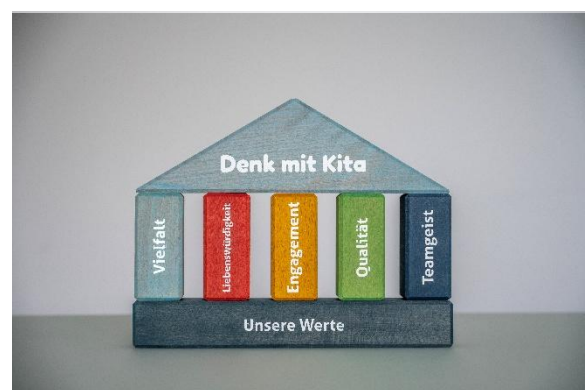
Bild: Unternehmenswerte von Denk mit Kita

Deswegen haben wir uns als Denk mit Kita nicht nur die Werte Engagement und Liebenswürdigkeit vorgenommen, die im Einflussbereich der einzelnen Person liegen, sondern auch den Wert Teamgeist, weil wir der Überzeugung sind, dass die Qualität unserer Arbeit nur im Team erhalten und ausgebaut werden kann. Ein gut funktionierendes, eingespieltes Team wiederum besteht aus engagierten und liebenswürdigen Teammitgliedern, die sich mit diesen Eigenschaften und ihren persönlichen Kompetenzen und Ressourcen eigenverantwortlich in das Team einbringen.