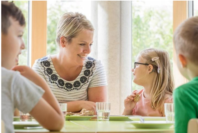
Bild: Pädagogin mit Kind

Wir führen in der Trennungsphase feste Rituale für das Kind ein. Das kann das tägliche Winken am Fenster sein, das Mitbringen eines vertrauten Spielzeugs, eines Kuscheltiers oder das Singen eines Liedes. Oft helfen auch unterstützende Dinge wie der Schnuller oder das Lieblingstuch, um den Übergang von Vertrautem zu Neuem zu erleichtern. Die Verabschiedung fällt dem Kind leichter, wenn sie kurz, aber trotzdem liebevoll ist. Auch vielen Familien fällt der Abschied schwer. Das persönliche Übernehmen des Kindes durch die Fachkräfte hilft den Familien, den Abschied